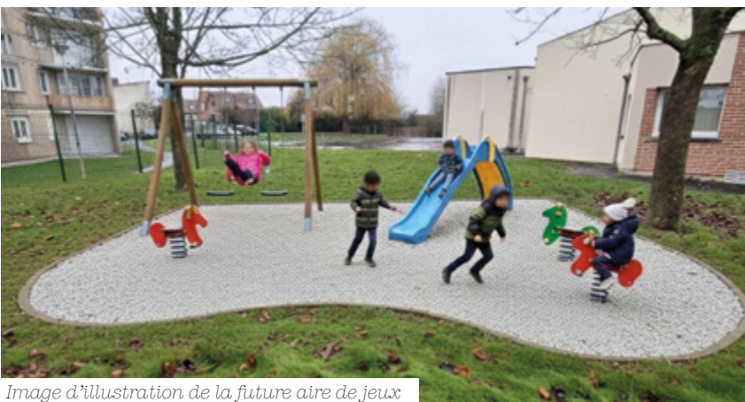
Image d'illustration de la future aire de jeux

Après l'aménagement de l'aire de jeux quartier Roosevelt et du terrain d'activités au quartier Paul Doloy, des travaux sont prévus dans le quartier du Pommelotier. L'installation d'une nouvelle aire de jeux destinée aux enfants de 2 à 6 ans