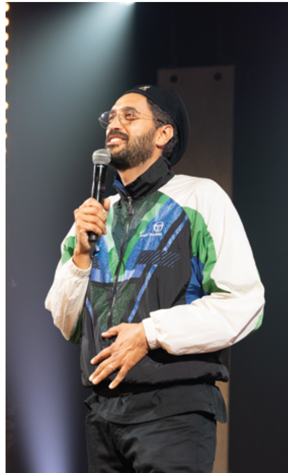
Renan Luce (20.11.26) - Demain tout le monde aura oublié (15/01/27) - Duo Zuiun (27/09/26 et 13/02/27) - Djamil le Shag (04/06/27)