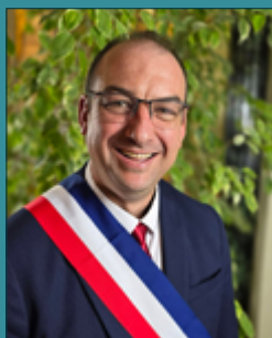
Aurélien GALL Maire de Tergnier